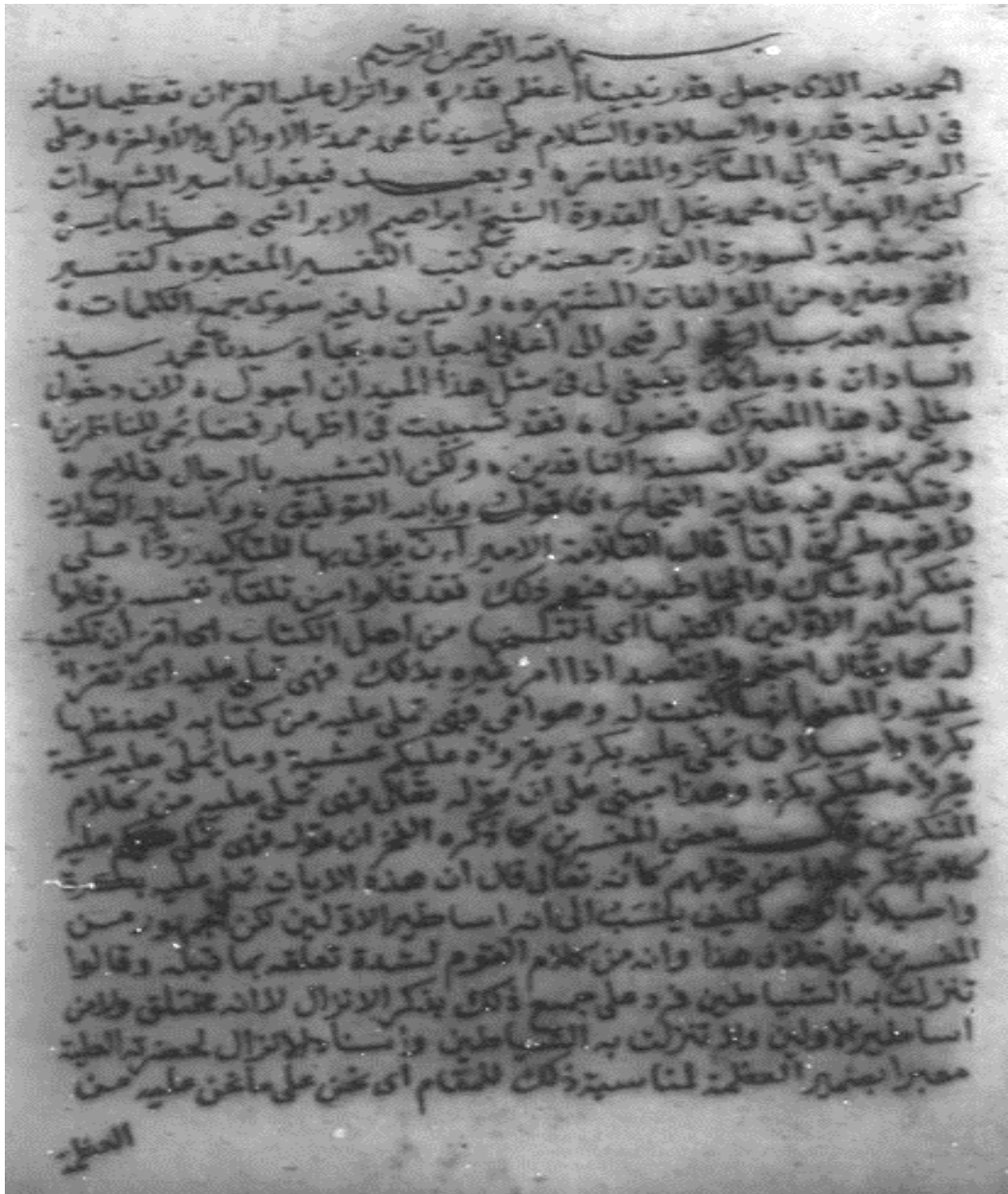
اللوحة الأخيرة من المخطوط النسخة (أ)